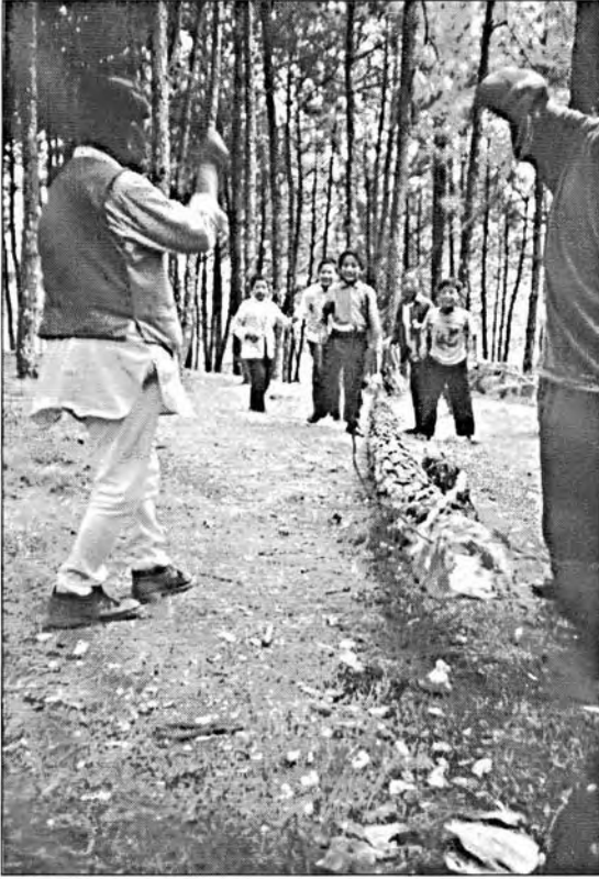
पौच गणेशको जङ्गलमा ढालिराखेको सल्लाको नागको रूपमा रूख