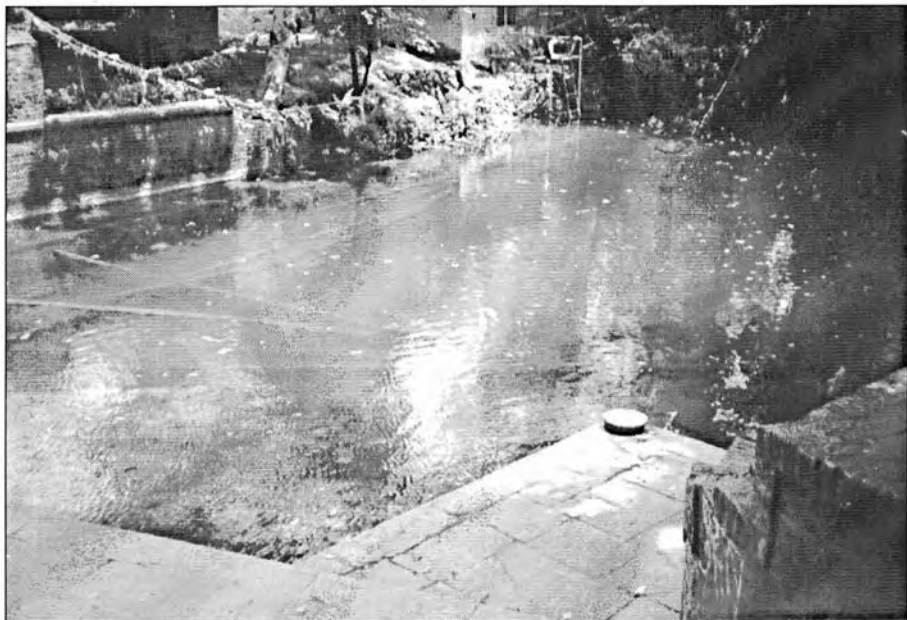
नागनागिनी रूपी पुराना सल्लाका रूखहरू जल समाधिमा रहिरहेको