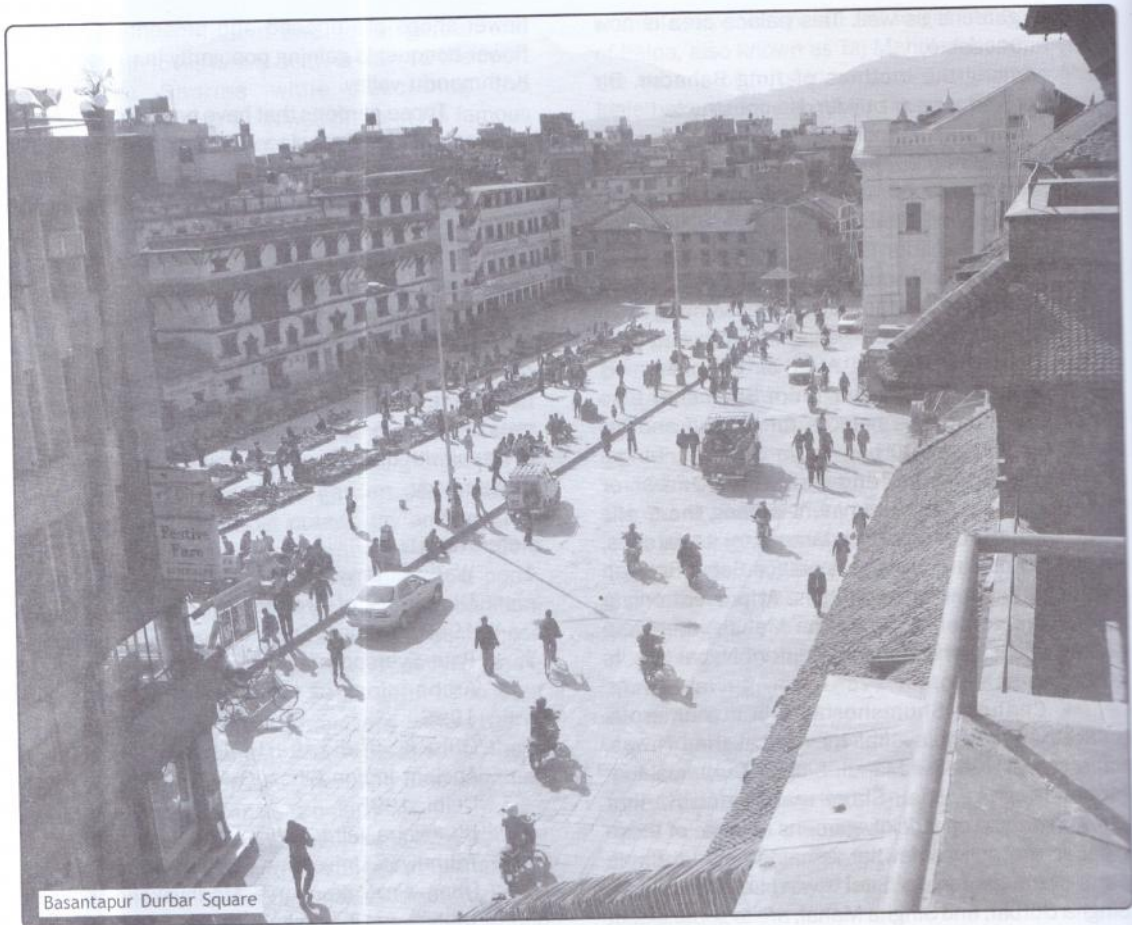
Basantapur Durbar Square