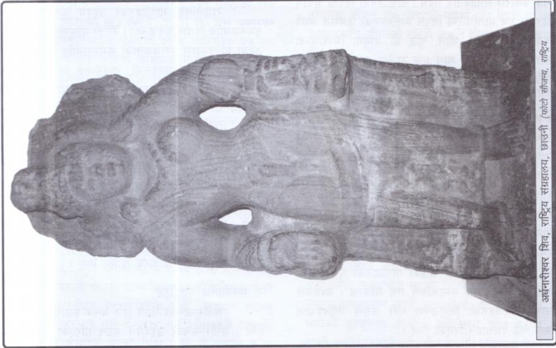
अर्धनारीश्वर शिव, राष्ट्रिय संग्रहालय, छाउनी