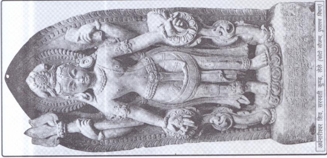
अर्धनारीश्वर शिव, सरस्वती कुण्ड, लेले