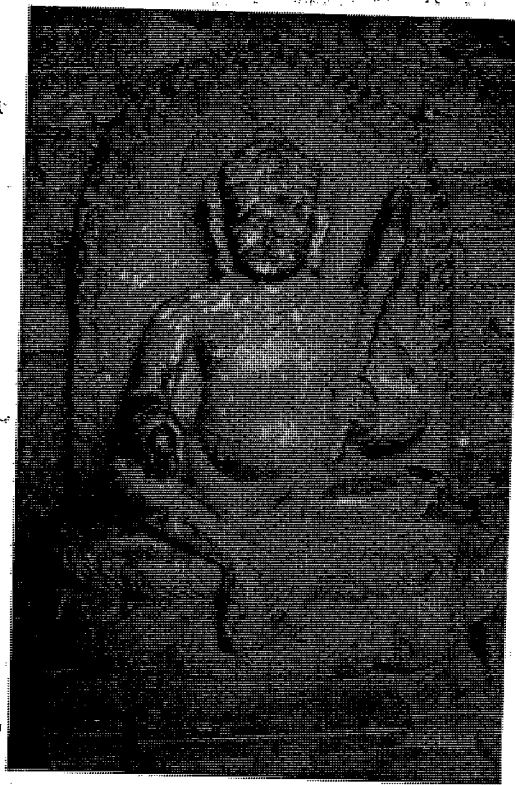
ख, ललितपुर सुनधारामा रहेको कार्तिकेयमूर्ति ।