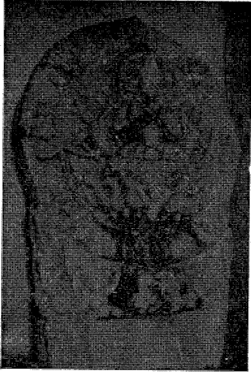
क, ललितपुर सीगल टोलमा रहेको सूर्यमूर्ति ।