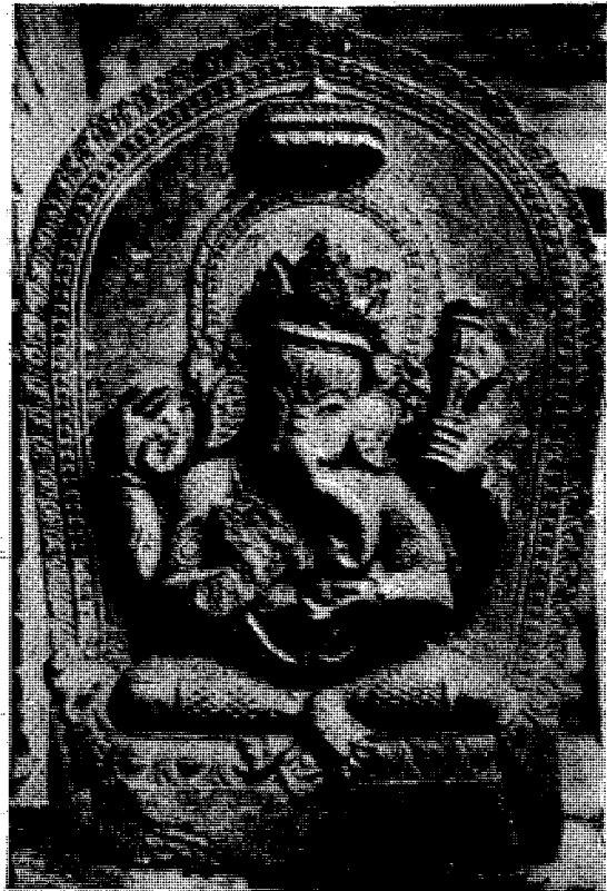
मङ्गल बजार मूछे आगम स्थित गणेश