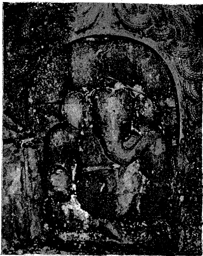
पाटन ढोका समीपस्थ मन्दिरभित्र प्रतिष्ठापित गणेश