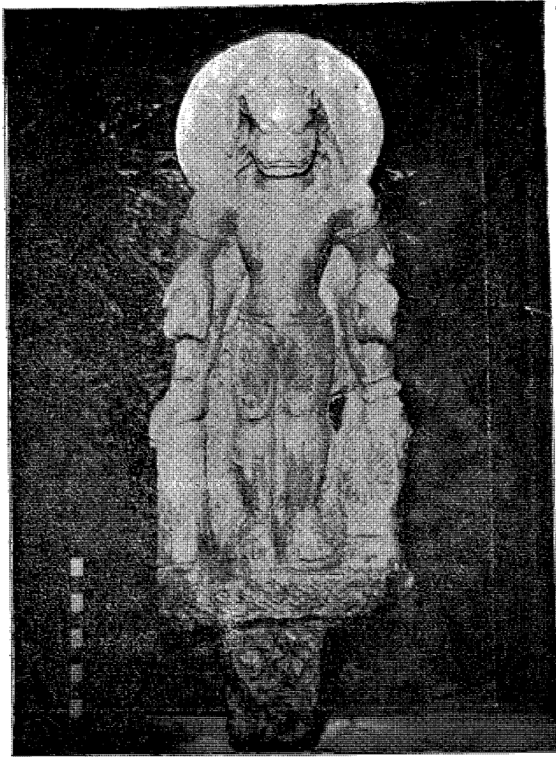
इनरुवाको नरसिंह मूर्ति