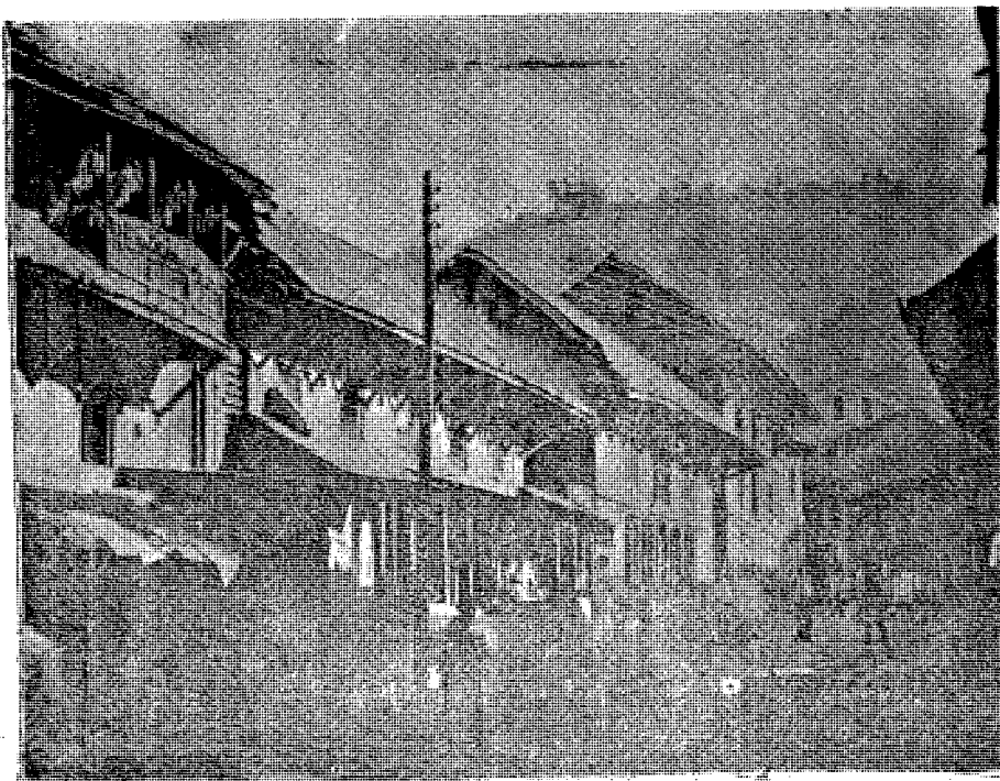
तानसेन नगरको केही पुराना घरहरू