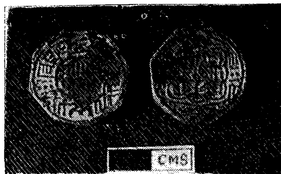
(२) रणजित् मल्लको चाँदी र माटोको मुद्रा (?) को पृष्ठ भाग