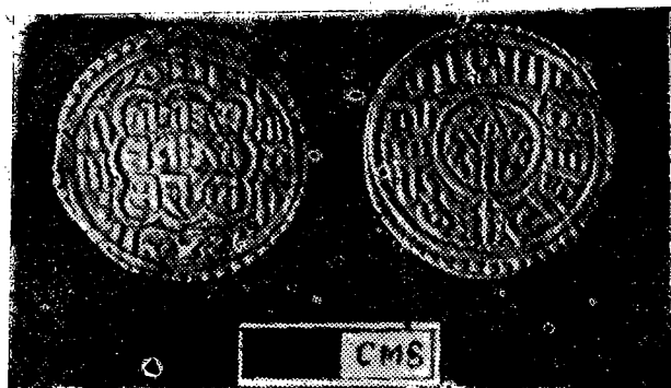
(१) रणजित् मल्लको चाँदीको र माटोको मुद्रा (?) को अग्र भाग