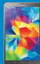
Samsung GALAXY TAB S