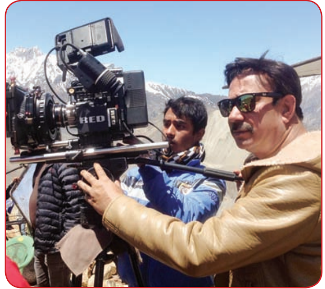
अभिनेता भुवन केसी

चलचित्र जुनी, सम्भना र कुसुमे रूमालमा अभिनय गर्दा आफू भर्खरको युवा भएको र अहिले एउटा परिपक्व कलाकार भएको बताउने सुपरस्टार नायक भुवन केसीले कलाकार कहिल्यै बूढो नहुने तर्क गरेका छन् । जति उमेर ढल्किदै गयो त्यति नै कलाकारको अभिनय अझ परिपक्व बन्दै जाने नायक केसीको बुझाइ रहेको छ । यद्यपि,