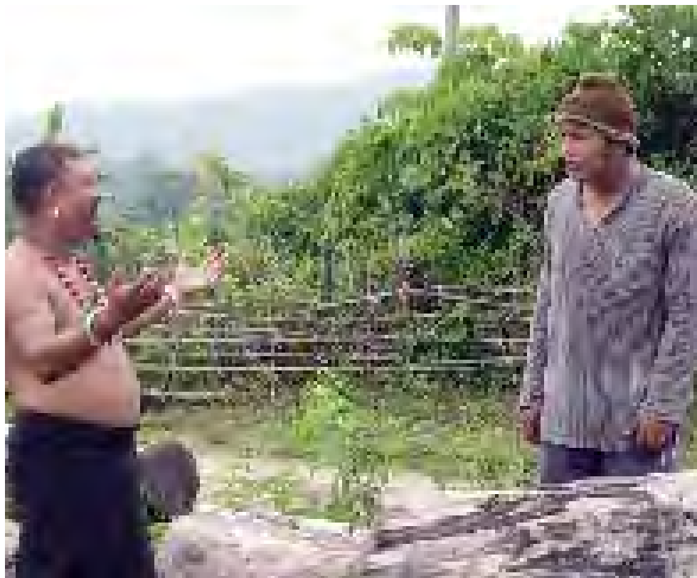
(Above, Left and right) Scene from the slapstick comedy Nai Malai Kehi Chaidaina . (Below) Audiences leave the cinema hall after the movie's premier in Dharan.