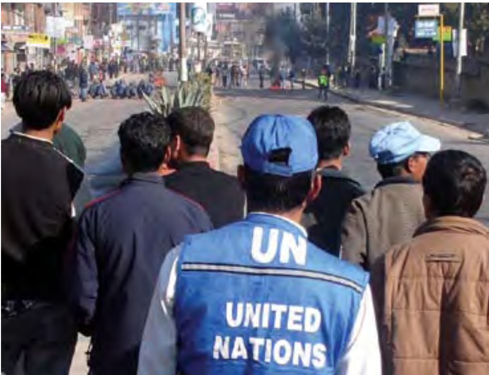
The massacre in Nagarkot was quickly politicised, spurring riots such as this clash between Student Union members and Police outside Pulchowk's Engineering Campus and UN Headquarters.

The Shanti Mandal has been hosting quite a few Saajhbatti programs this past year. The Himsaa Birodh Abhiyaan (Campaign Against Violence) has been responsible for these events, vowing that as long as people continue to be killed in the conflict, they will light candles in their memory and urge people to pray for peace.