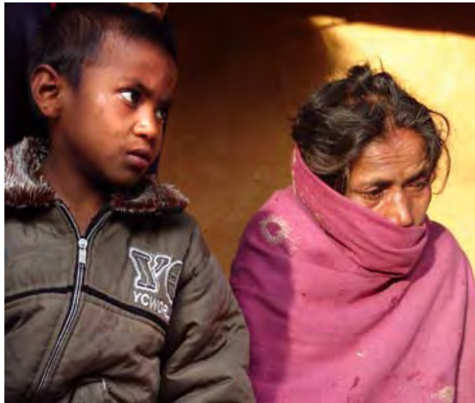
(Above) Shock and grief soon turned to anger and resentment in the area. (Below) This tree, along with many people, were struck by the bullets sprayed RNA soldier(s) using machine guns. Many people tried to hide behind trees when the unexpected attack began.