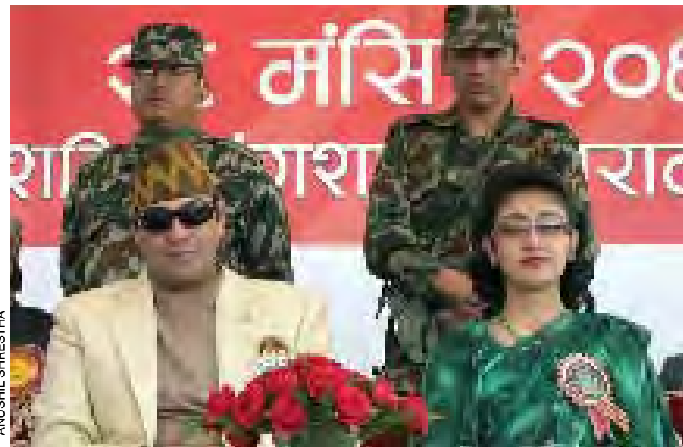
Crown Prince Paras and his wife Princess Himani attend the Birat Mahotsav 2062.

०५७ साल पछि चार वर्ष हुन नसकेको विराट महोत्सव बृहत रमभूमका साथ २८ मंसिर देखि ६ पुष मा सम्पन्न हुदैछ । पुर्वाञ्चलकै ठुलो औद्योगिक व्यापारिक नगर विराटनगरमा व्यापार र मनोरञ्जनलाई एकै थलोमा राखेर सुरु भएको पुर्वाञ्चलकै बृहत नौ दिने “विराट महोत्सव २०६२” को उदघाटन २८ मंसिरमा युवराज्ञी हिमानीको उपस्थितीमा युवराजधिराज पारस वीर विक्रम शाहदेव बाट भएको थियो ।