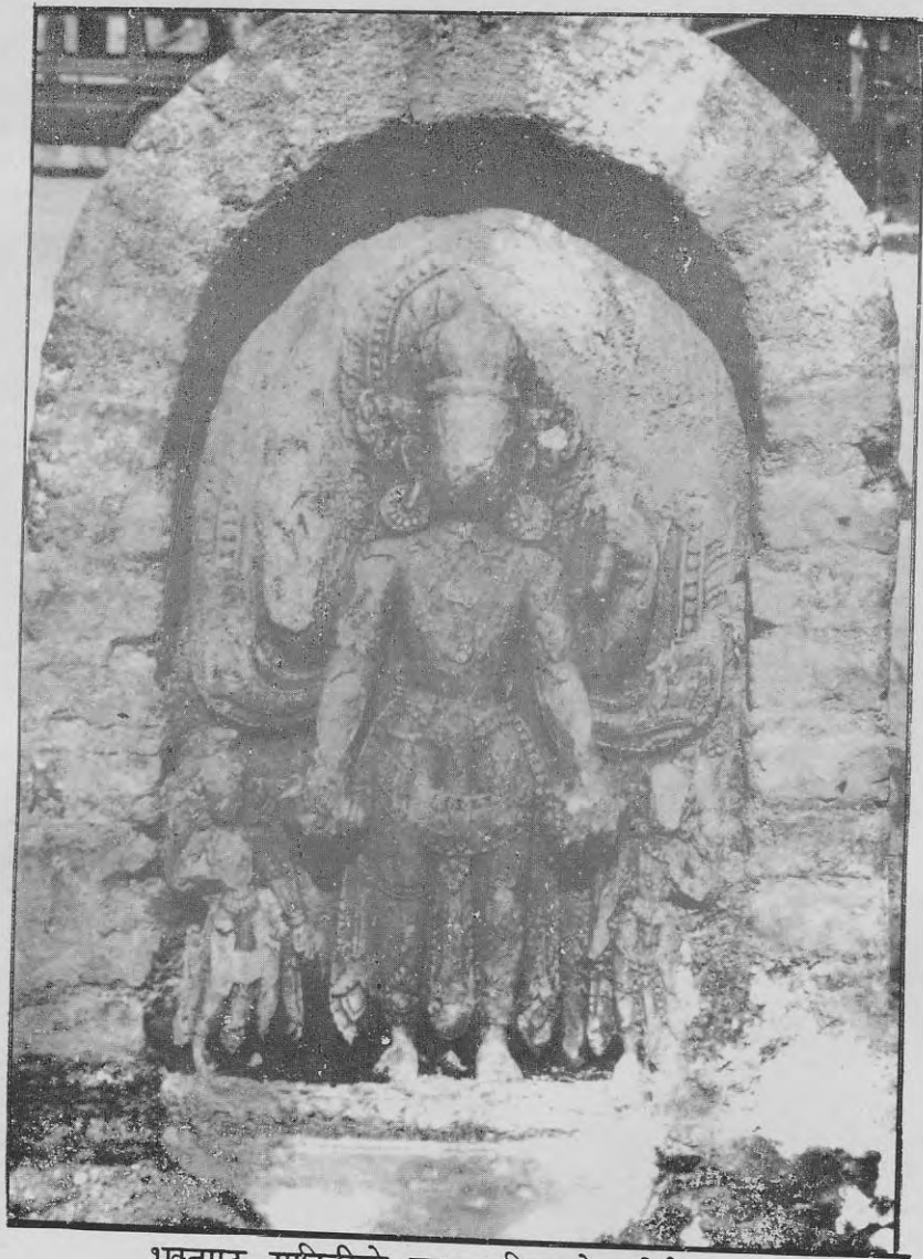
भक्तपुर गाहिटीको वामन विष्णुको मूर्ति ( वि.सं. १५३३ )