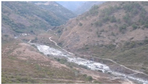
དམག་རྒྱབ་སའི་ས་གནས་མང་ཕུང་།

བཞིན་མ་ལས་ལཱ་རི་ལུ་བསྐྱེལ་ཡོད་པ་ཡིན་རུང་། འ་ནི་མགུ་ཉོ་འདི་ལོ་རིམ་བཞིན་དུ་ཡར་ འཕེལ་འགྱོ་སར་མཐོང་སྟེ། བཀའ་ཤིས་སྐྱང་གོ་མང་འོག་ལུ་ཡོད་པའི་གཡུས་ཚན་བསགས་སྟེང་ ཟེར་མི་ནང་ལས་གུ་རུ་ཟེར་ལུ་མི་སྐྱམ་གིས་སྦྱིན་སྟེག་གནང་སྟེ་དམ་ལུ་བཏའ་ཉེ། ལཱ་རི་ལས་ ཡིན་མི་སྦྱིས་ལང་ཟེར་མི་འདི་གིས་ས་གནས་འདི་ཁར་མཚོན་རྟེན་ཅིག་བཞེངས་ཡོད་པ་ དང་། མཚོན་རྟེན་དང་ས་གནས་ཚུ་ད་ལྟོ་འདི་བར་ན་ཡང་མཇལ་ཚུགས་པ་ལས། གཡུས་འདི་ ཁའི་མི་སེར་ཚུ་གིས་ས་གནས་ཀྱི་མིང་ཡང་ས་སྟོ་ཉོ་ཟེར་སྐབ་དོ་ཡོད་པ་ཡིན། དེ་ལས་བཅན་ཡུན་ བདག་གླིང་གིས་བཅན་ཚོང་ཚོང་མ་གི་གནས་ཁང་འདི་ལུ་མེ་མང་འུའ་ཉེ། དོང་སྟེན་བཏང་ ཡོད་པ་ལས། ཤར་ཕྱོགས་བཀྲིས་སྐྱང་ལུ་ཡོད་པའི་ཚོང་ཚོང་མ་གི་གནས་ཁང་འདི་ དོང་སྟེན་དེ་ ཡོད་པ་མཐོང་ཚུགས་ཟེར་བཤད་ཚུལ་འདུག། ཡིན་རུང་ལྷོ་ནུབ་སྐབ་ཚོས་གླིང་དགོན་པའི་ གཙུ་འཛིན་གྲུབ་བསོད་ནམས་ཚོས་རྒྱལ་གྱིས་གསུངས་མིའི་ནང་། དེ་ནང་ཤིང་དང་ནགས་ཚལ་ སྤྱག་པོ་སྦྱས་ཡོད་པ་ལས། དོང་འདི་ད་རེས་ནངས་པ་མཐོང་མི་ཚུགས་པས་ཟེར་ཡིན་མས། ཞོང་ གི་དམག་ལུ་བརྟེན་ཉེ་བཅན་ཡུན་བདག་གླིང་ཟེར་ལུ་མི་འདི་བཅན་པ་ལོ་ཅིག་ཡིན་ཟེར་ཤིང་ མཁར་ལཱ་རི་གི་མི་གན་ཤོས་ཚུ་གིས་སྐབ་ནི་ཡོད་པ་ཡིན།