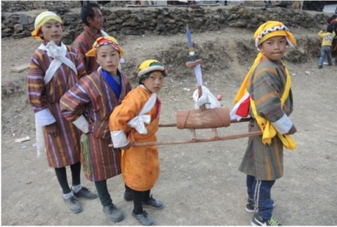
ཨ་ལོ་ཚུ་དབང་ཕྱག་ཆེན་མ་འབག་འཇོ་བའི་མཐོང་སྐྱེད།

ཕྱག་ཆེན་མ་དང་བཅན་དར་ལུ་མི་ཚུ་ལྟ་ཁང་གི་སྤོ་ལོགས་ཁར་སློ་སྐྱོར་བརྒྱབ་སའི་ཐང་ན་ལྟོད་པ་ ད། དབྱངས་དཔོན་དང་དཔལ་མཛེས་པ་ཚུ་གིས་ཐང་ན་ལོགས་སོ་འཐེན་ཏེ་ལེའུ་བསྐྱུར།