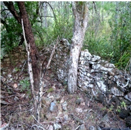
Ruins of houses.

be a leaf of Bakalingshing, a tree which grew in Tsangkhar. Informants assert that the leaf spoke to her stating that it had searched her for very long time, and it had worn out nine pairs of steel shoes searching for her. And thus saying, the leaf turned into a demon. People hold that the evil spirit of Tsangkhar community had transformed into a leaf and traveled all the way to Tibet in search of the lady who escaped, and captured her soul and killed her there. With this last killing in Tibet, the generation of the Tsangkhar community was put to an end. Eventually the Tsangkhar community was left devoid of human life and settlement. The local people said that even today, they refrain from chopping the trees at Lebarimanang for fear of being harmed. It is also said that if any tree is cut down the people would die suddenly without having time to perform rituals to appease the evil spirit.