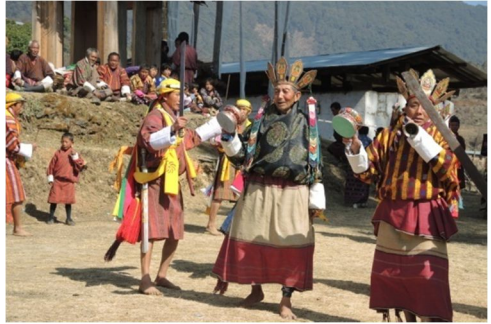
དཔལ་ལོ་དང་དཔལ་མཛེས་པ་ཚུ་ཐང་ན་འཆམ་རྒྱབ་སའི་མཐོང་སྐྱེད།

དེ་ལས་བྱིས་པའི་དཔལ་ལོ་གཉིས་ཀྱིས་ཐང་ར་བདེ་བར་བསྐྱོར། མར་ཆང་ཕྱག་དབང་བཅར་སྤེ་ མར་ཆང་ཕྱད་གཏོར་མ་ཨིན་པས། སྤྱིར་བཏང་མར་ཆང་གི་སྐབས་མར་ཆང་ཚིག་ཡང་ང་བཅས་ པའི་རྒྱལ་ཁབ་ནང་ཡོངས་གྲགས་ཡོད་མི་འདི་རང་ཨིན་རུང་། ད་ལྟོ་གི་སྐབས་ལུ་མར་ཆང་རྒྱས་ པ་ཟེར་ཚིག་ཡང་མ་དྲམ་སྤེ་འདུག།