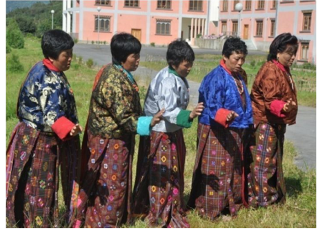
སྤྱག་རྩེ་པའི་ཨམ་ཚུ་ཞབས་ལྷ་རྒྱལ་པའི་མཐོང་སྣང།