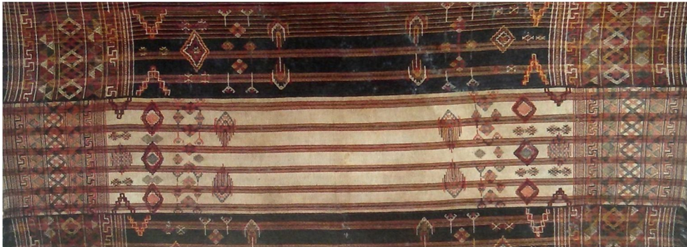
དགྲི་ར་ལ་ལུ་སྐྱུག་ལས་མེ་རྟོག་མེད་པ་འཐག་ནི་ཡོད་པའི་དཔེ། (Textile Arts of Bhutan)

ནང་ལུ་གོ་ལ་གི་མ་དང་མེ་རྟོག་གི་ཚོས་གཞི་རྩུ་ཡང་རང་གི་དང་འདོད་དང་ཁ་འཇགས་ལུ་མེ་རྟོག་ ལྷོ་ལྷོ་བཅུགས་ཏེ་འཐགས་མ་ཚད། རྒྱ་ལེགས་ཏིང་དང་འཁྲིལ་དགྲི་རའི་རལ་པ་རྩུ་མ་བཏོག་ པར་ཐོན་ནི་འདུག། གོ་ལའི་རྒྱ་རྩུ་ཡང་སྲོན་མ་ལག་ལེན་འཐབ་མི་རྒྱ་རྩུ་ལས་མང་ཆེ་བ་ད་རེས་ ནངས་པ་རང་སོའི་འབྲོར་པ་དང་བསྐྱུན་ཀེ་རི་ཀོ་ཀུན་དང་གསེར་ཤོས་ལ་སོགས་པའི་རིགས་རྩུ་ ལག་ལེན་འཐབ་ཨིན། དེ་མ་ཚད་སྲོན་མ་གོ་ལ་བརྒྱུད་ས་གསུམ་སྤེ་འཐག་མི་འདི་ད་རེས་ནངས་ པ་འགྱུར་བཅོས་འབད་དེ་ གོ་ལ་བརྒྱུད་ས་ཐགས་གཉིས་འཐག་ཞིན་ན་དགྲི་ར་ཕྱེད་ཀ་ཟེར་དར་ བྱབ་སོང་སྤྲོ་ཡོད་པ་ཨིན།