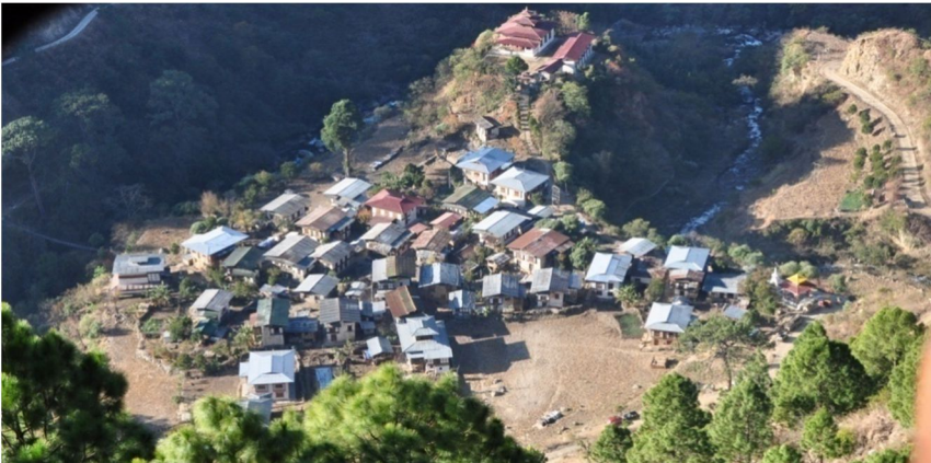
མཁོ་མའི་གཡུས་ཚན།