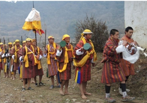
གནམ་རྒྱལ་སྐྱང་ལས་བཙན་དར་ལུ་བའི་མཛོད་སྤུལ།

ཉིན་མ་གཉིས་པ་གི་ལས་རིམ་འདི་དངོས་གཞི་གི་ལས་རིམ་ཨིན་པས། ལས་རིམ་འདི་ནང་ལུ་རྩོ་ པ་ཉ་སྟག་རང་ ཁོང་དབྱངས་དཔོན་གཉིས་དང་ བྱིས་པའི་དཔའ་བོ་གཉིས། དེ་ལས་དཔའ་ མཛེངས་པ་དམངས་གཟབ་ཆས་བསྐྱིགས་ཏེ། སློ་སློར་རྒྱབ་ས་ལས་ཀི་ལོ་མི་ཏར་, དེ་ཅིག་གི་ས་ སློ་ལུ་ཆགས་ཡོད་པའི་རྣམ་རྒྱལ་སྐྱང་གི་བྱིམ་ནང་བཙན་དར་ལུ་བར་འགྲོམ་ཨིན་པ་དང་། བྱིམ་ འདི་ནི་དུས་དང་སྤུ་ལས་ར་སྤུར་པ་གི་བཙན་དར་ལུ་ས་ཅིག་ཨིན་མས། ཁོང་ཚུ་བྱིམ་འདི་ནང་གི་ མཛོད་བཤམ་ནང་སྟོད་པ་ད་ལྷུག་འཚལ་སྟུན་དར་སྤུལ། དེ་ལས་ཁྲུས་ཚུ་འབྱུང་སྟེ་དུ་ཚར་གསུམ་ བརྒྱབ་སྟེ། དཔའ་མཛེངས་པ་ཚུ་གི་གྲལ་ལས་གཅིག་གིས་མཛོད་བཤམ་ནང་ལས་བཙན་དར་ ལུམ་ཨིན་པས།