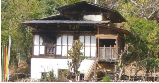
ཨ་ཐང་ལུ་ཡོད་པའི་ཞབས་དུང་འཇིགས་མེད་འོ་ར་བྱའི་སྐྱུ་མའི་གཟིམ་རྩུང་གི་མཚོང་སྤང་།

མོ་ར་གི་བྱིམ་ནང་ཡང་སློམ་མའི་སྐྱུ་མཚོད་དང་འབྲམ་ཅིག་སྟེ་ལོ་ལྟར་བཞིན་དུ་ཚོ་གྲུ་ཉིན་མ་གཉིས་ རིང་གནང་སྟོལ་གྱི་ལམ་ལུགས་གཞི་བཙུགས་གནང་ཅུག།