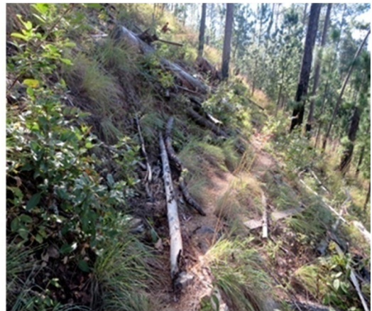
Remains of irrigation channel