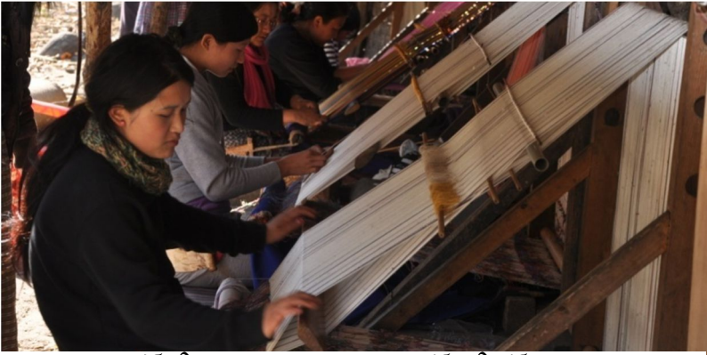
མཁོ་མའི་ཨམ་སྐུ་ཚུ་སྤང་ནང་ཐགས་འཐག་སྡོད་པའི་མཐོང་སྣང།