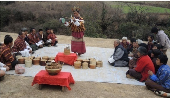
དཔའ་བོ་གིས་དམངས་མོ་བཏབ་པའི་སྐྱང།

དེ་ལས་ཚོས་པ་གཉིས་ཀྱིས་རྒྱ་སྤྱིང་འཕུ། དཔའ་མཛེངས་པ་གི་ར་གིས་གྱི་ཤུབས་ནང་ལས་བཏོན་ ཏེ། གནམ་ཁར་སྟོང་ལེགས་སོ་འབྲེན་སྟེ་པད་སྟོར་བསྐྱར་ཏེ་ཕྱི་ཁར་འབྲེན་འགྲོམ་ཨིན་པས། ཁོང་ཚུ་བྱིམ་གྱི་ཕྱི་ཁར་སྟོད་པ་ད། བྱིམ་གྱི་སྤྱིན་བདག་གིས་ཕྱི་ཁར་བཙན་སྐྱིག་བརྒྱབ་སྟེ་ མར་ ཆང་བཀལ་བཞག་པ་ཨིན་པས། དེ་ལས་མར་ཆང་གི་རྩ་བར་སྟོད་པ་ད། ཁོང་དཔའ་མཛེངས་པ་ཚུ་ གིས་ལེགས་སོ་འབྲེན་སྟེ་མར་ཆང་གཡས་སྟོར་རྒྱབ། དེ་ལས་བྱིས་པའི་དཔའ་བོ་གཉིས་ཀྱིས་