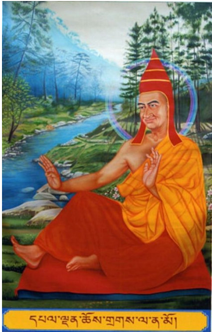
དཔལ་ལྷན་ཚོས་གྲགས་ལ་ན་མོ།

༄ ཚད་མའི་ལམ་ནས་ཐམས་ཅད་མཁྱེན་གྱུར་པའི། ཚད་མར་གྱུར་པའི་སྟོན་པ་ཉིད་དང་ནི། ཚད་མའི་ལམ་ནས་ཚོས་ཀྱན་འཆད་མཁས་པའི། ཕྱོགས་གྲང་ཡབ་སྲས་རྣམས་ཀྱིས་སྦྱང་གྱུར་ཅིག།