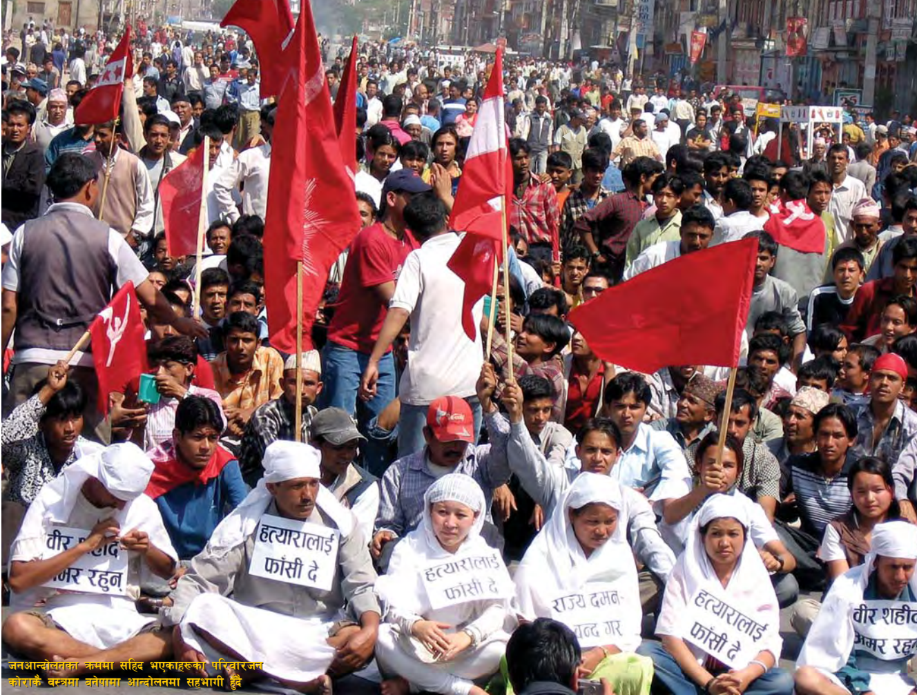
जनआन्दोलनका क्रममा सिंहदरवार भएकाहरूको परिवारजन कोराकै वस्त्रमा बनेपामा आन्दोलनमा सहभागी हुँदै