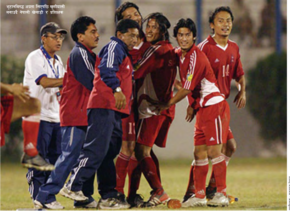
तस्वीरहरू : मकरपूज, नेपाल

भुटानविरुद्ध अग्रता लिएपछि खुसीयाली मनाउँदै नेपाली खेलाडी र प्रशिक्षक