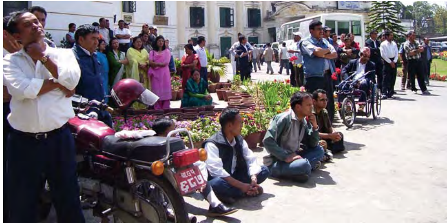
▲ सबै काम ठप्प पारेर आन्दोलनमा उत्रिएका राष्ट्र बैंकका कर्मचारीहरू

सुरक्षानिकायले रकम भुक्तानी पाउन नसकेपछि