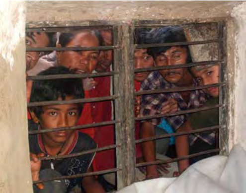
▲ माओवादी आक्रमणका साक्षी बुटवलवासीहरू