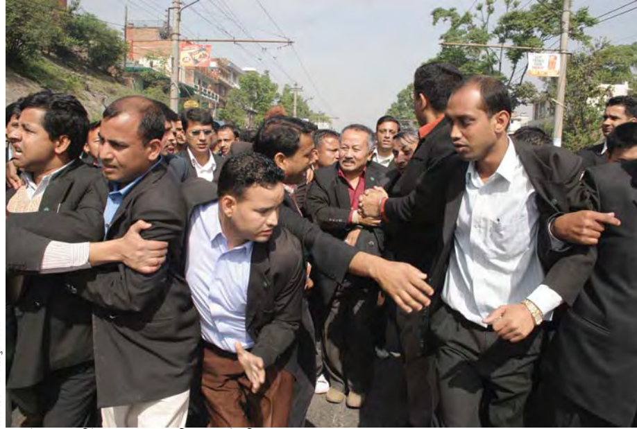
▲ बर्बरतामा ओर्लिएको सरकारले वकिलहरूलाई पनि छोडेन

निजामती कर्मचारीभन्दा अधि नै वित्तीय, उत्पादन र सेवा क्षेत्रका संस्थानका कर्मचारी लोकतन्त्र स्थापनाको आन्दोलनमा सरिक भइरहेका छन्। कृषि विकास बैंक, चलचित्र निर्माण संघ,