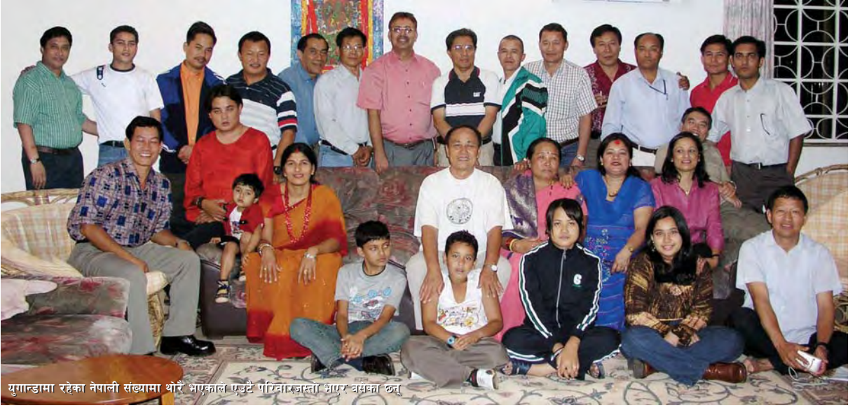
युगान्डामा रहेका नेपाली संख्यामा थोरै भएकाले एउटै परिवारकास्ता भएर बसेका छन्