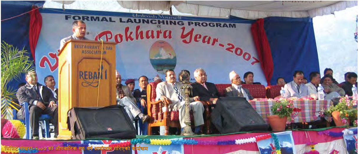
भिजिट पोखरा-२००७ को औपचारिक सुरु गर्न आमोजना गरिएको कार्यक्रम