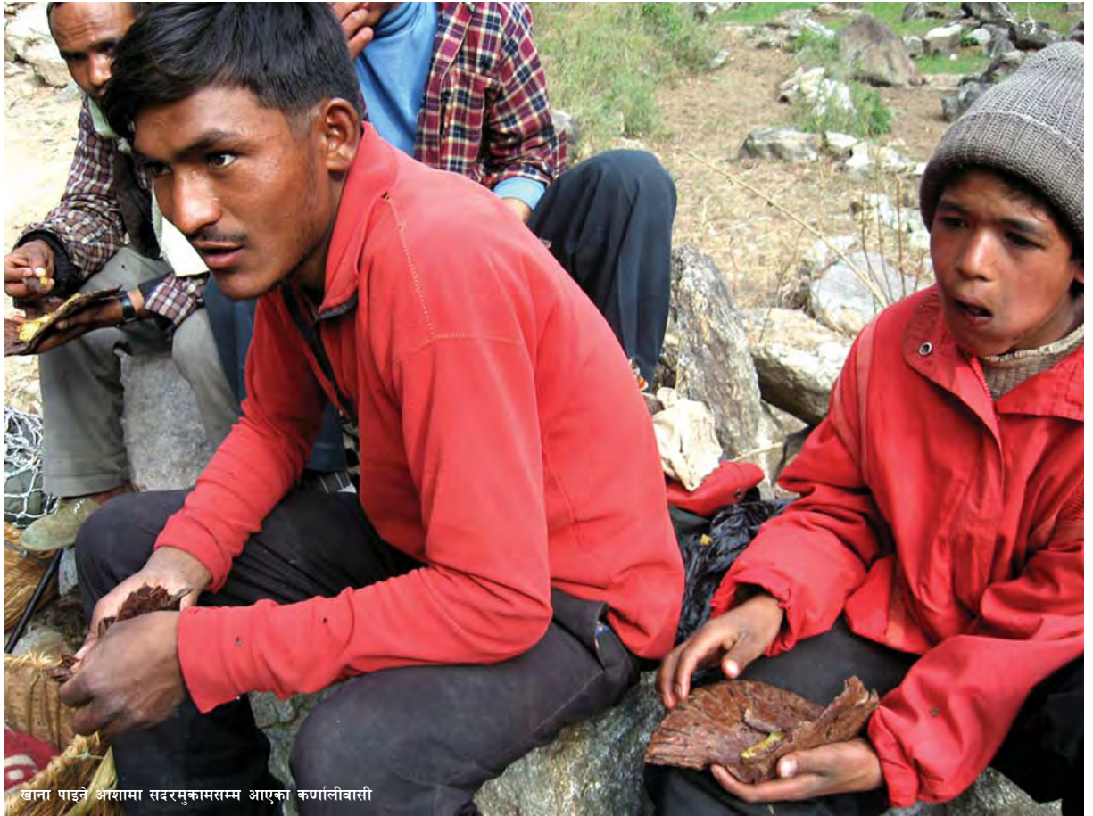
खाना पाइने आशामा सदरमुकामसम्म आएका कर्णालीवासी