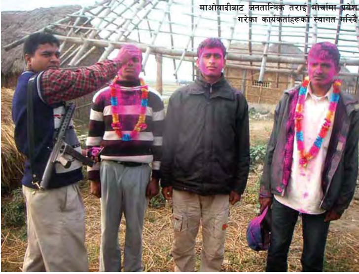
माओवादीबाट जनतान्त्रिक तराई मोर्चामा प्रवेश गरेका कार्यकर्ताहरूको स्वागत मस्दि