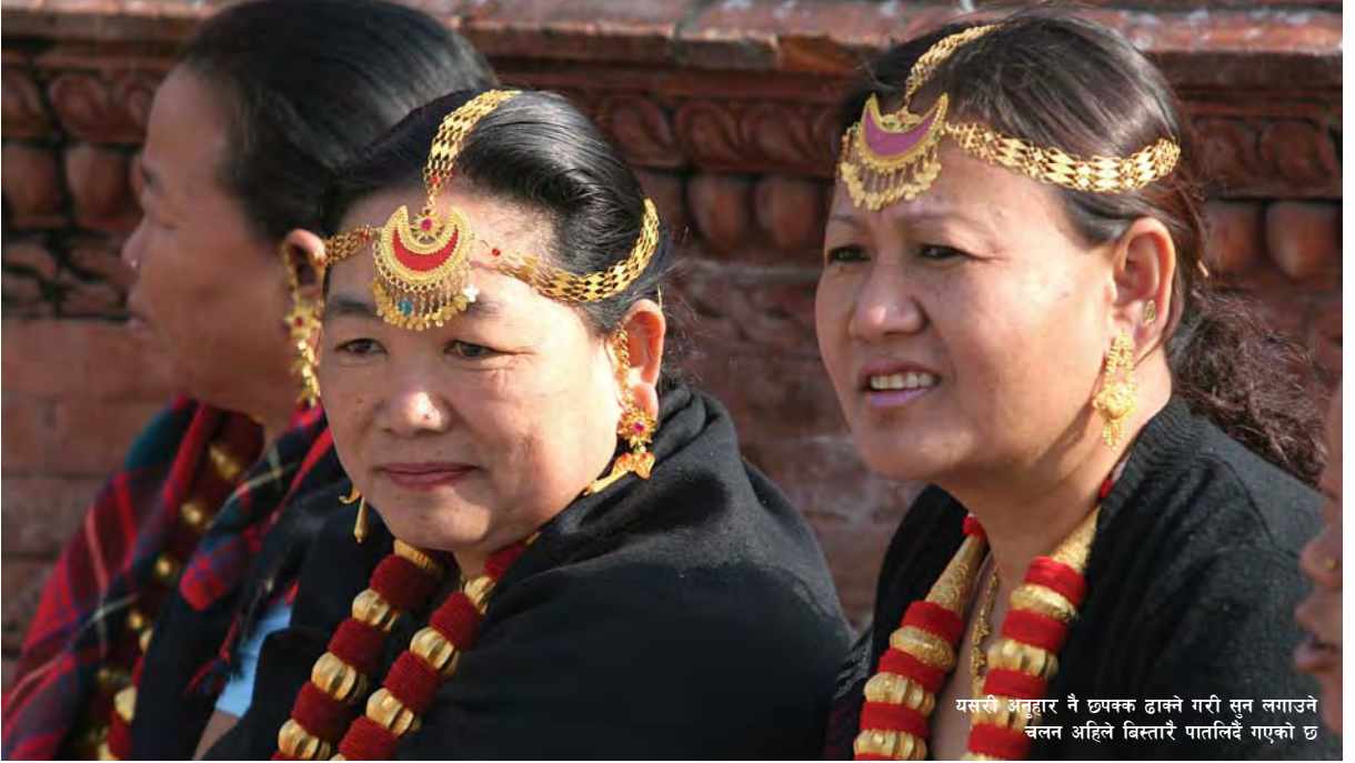
यसरी अनुहार नै छपक्क ढाक्ने गरी सुन लगाउने चलन अहिले बिस्तारै पातलिदै गएको छ