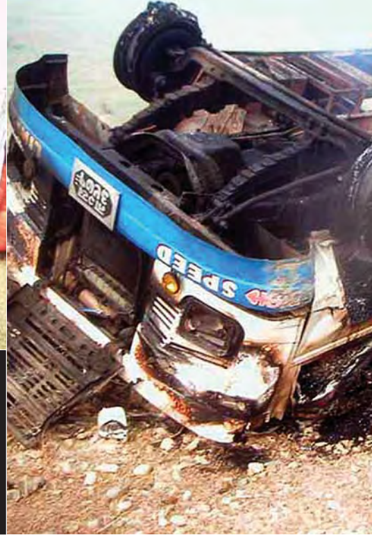
राजमार्गका कुदेका सवारी साधन पनि आतङ्कको सिकार बने