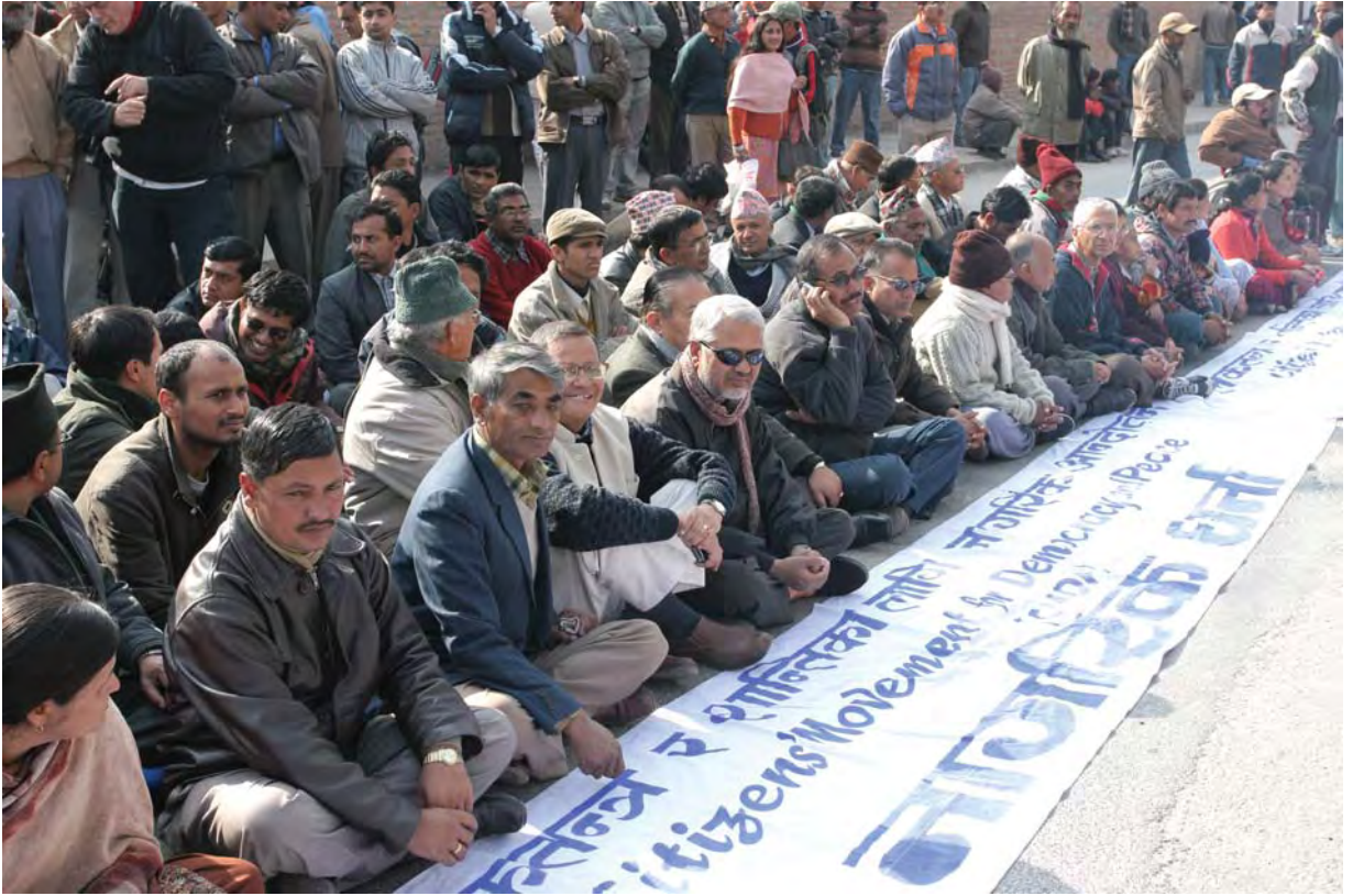
चित्रकार: तेज बस्नेत