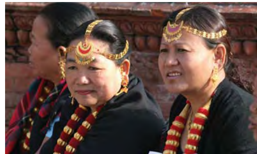
रंग : पहिलेजस्तो छपक्क सुनका गहना लगाएर हिँड्ने चलन घट्दै गएको छ ५६