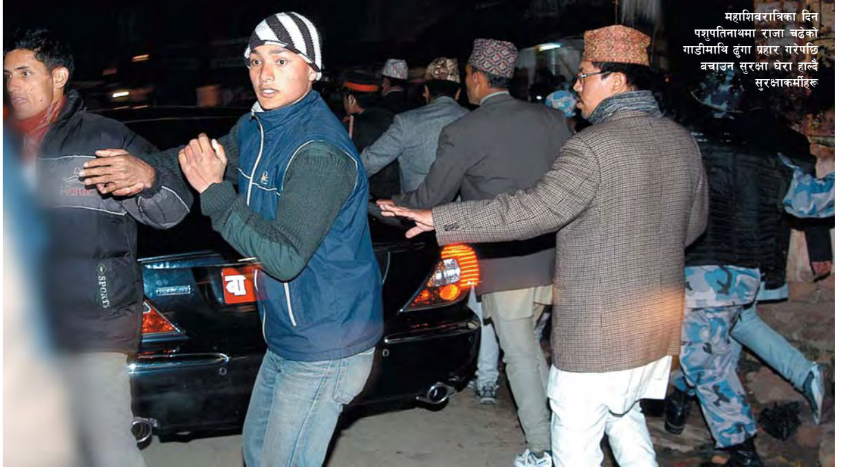
महाशिवरात्रिका दिन पशुपतिनाथमा राजा चढेको गार्डमाथि हुँदा प्रहार गरेपछि बचाउन सुरक्षा घेरा हाल्दै सुरक्षाकर्मीहरू

स्वीकार गर्ने सन्देश दिए पनि त्यो मन्तव्यले उनको राजनीतिक महत्वाकांक्षा नसेलाएको देखाइएको छ ।