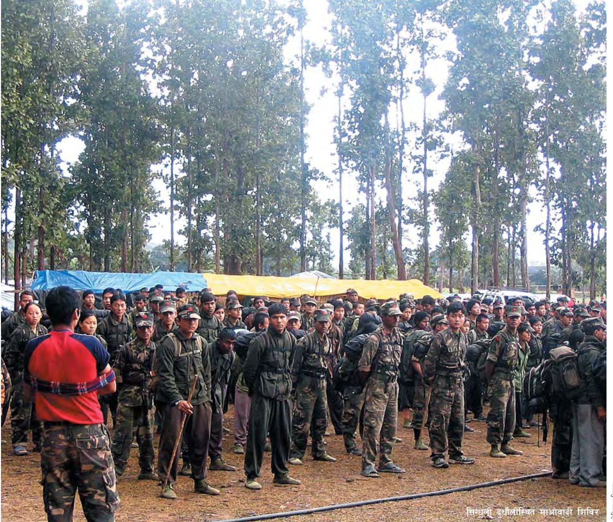
सिन्धुली इधौलीस्थित माओवादी शिविर