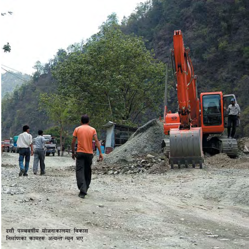
दसौ पञ्चवर्षीय योजनाकालमा विकास निर्माणका कामहरू अत्यन्त न्यून भए