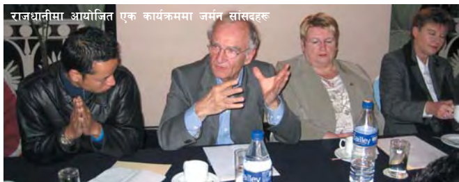
राजधानीमा आयोजित एक कार्यक्रममा जर्मन सांसदहरू