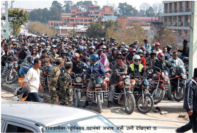
राजधानीमा पेट्रोलियम पदार्थको अभाव अझै उस्तै देखिएको छ

निगमको कमजोरी व्यापारीहरूले राम्रैसँग बुझेका छन् । किनभने भारतीय आयल निगम (आइओसी)लाई तेल खरिदको रकम भुक्तानीमा