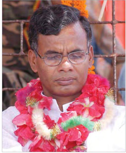
वनमन्त्री मातृका यादव