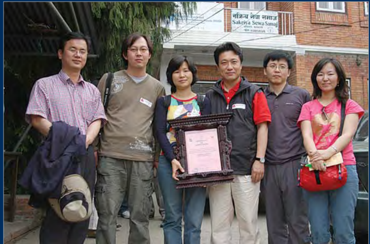
कोरियाली चिकित्सक टोली

भन्ने ज्ञान नहुँदा नै समस्या भएर आएको देखियो। यस्तो चेतना भयो भने शिविरमा देखिएका हाडजोर्नीका समस्या त आफै समाधान हुन्छ।'।