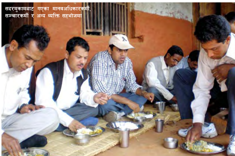
सदरमुकामबाट गएका मानवअधिकारकर्मी, सञ्चारकर्मी र अन्य व्यक्ति सहभोजमा