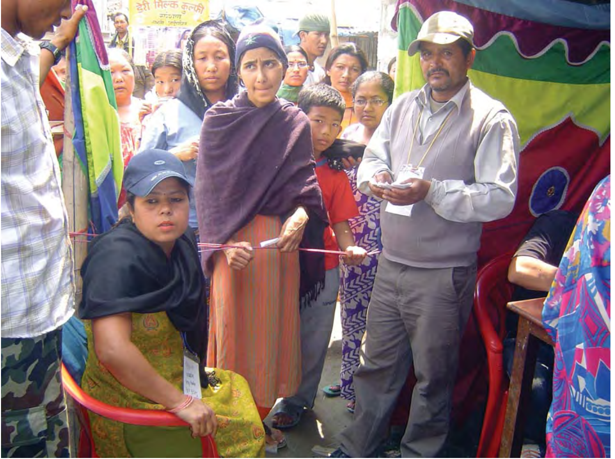
तस्वीरहरू : समय