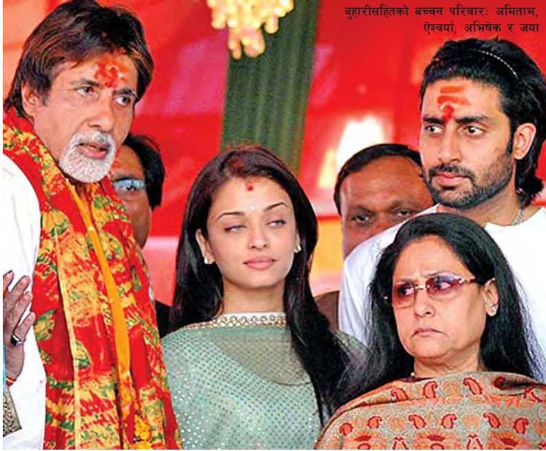
बृहारीसहितको बच्चन परिवार: अमिताभ, ऐश्वर्या, अभिषेक र जया