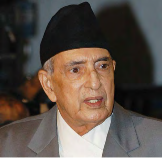
प्रधानमन्त्री गिरिजाप्रसाद कोइराला