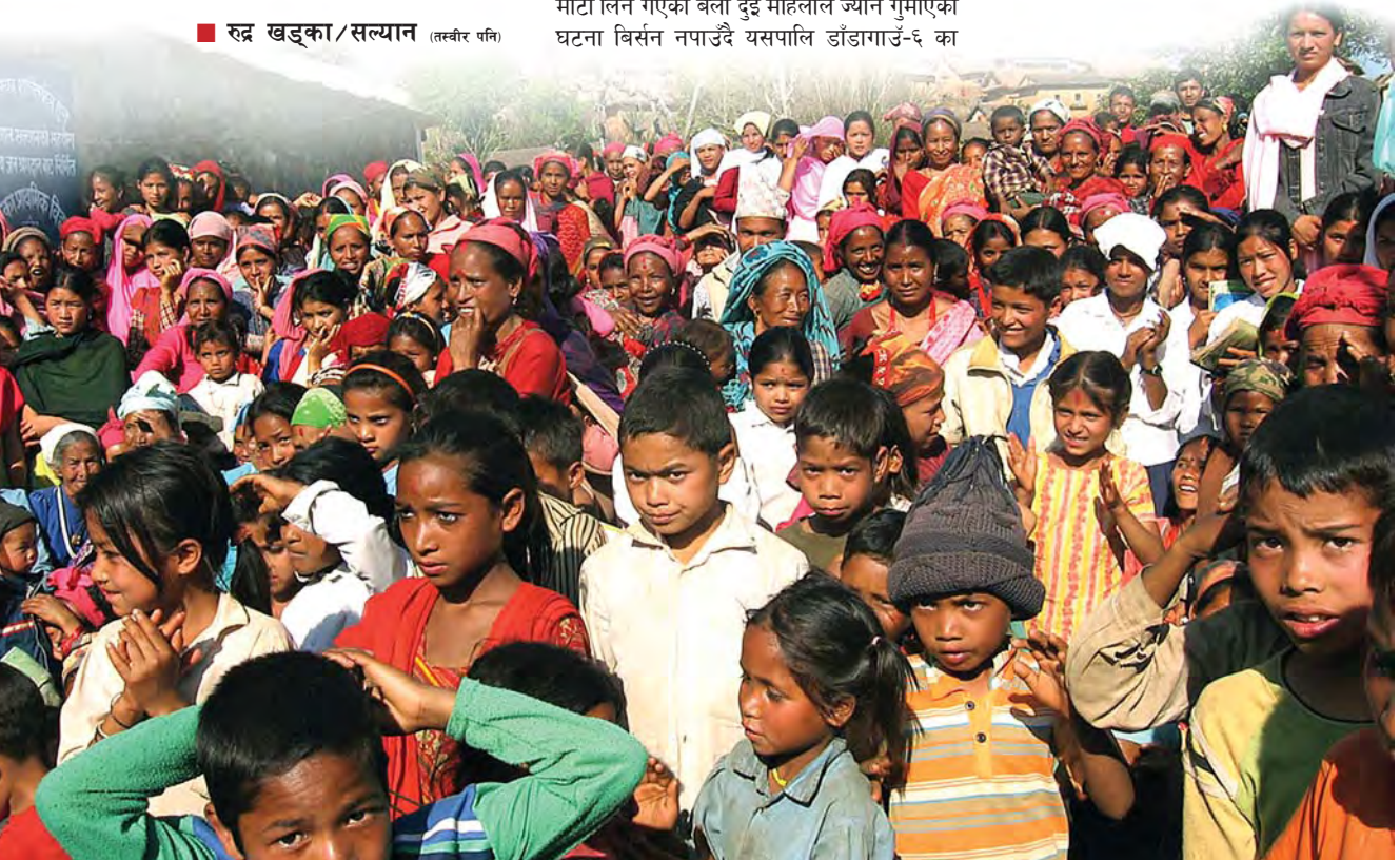
सल्यानका महिला र बालबालिका

आर्थिक विपन्नताका कारण कामको लागि उनका श्रीमान् भारत पसेको एक वर्ष भएको छ । श्रीमान् भारत पसेपछि उनको काँधमा यतिखेर तीनवटा बच्चाको लालनपालनको जिम्मेवारी मात्र