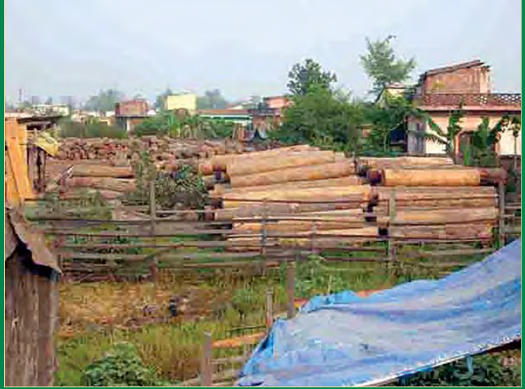
कैलालीको एक सःमिलमा थन्क्याइएका पहाडी काठ