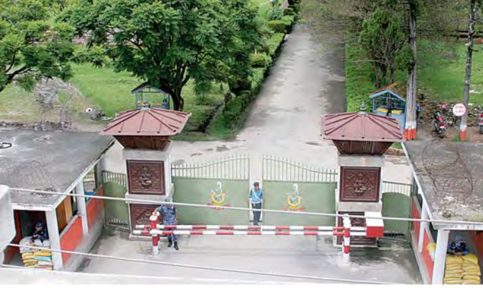
प्रहरी प्रधान कार्यालय