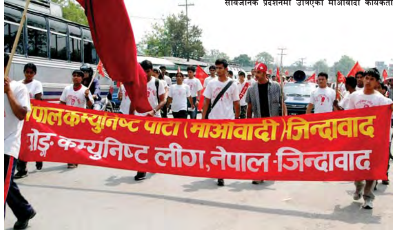
सार्वजनिक प्रदर्शनमा उत्रिएका माओवादी कार्यकर्ता