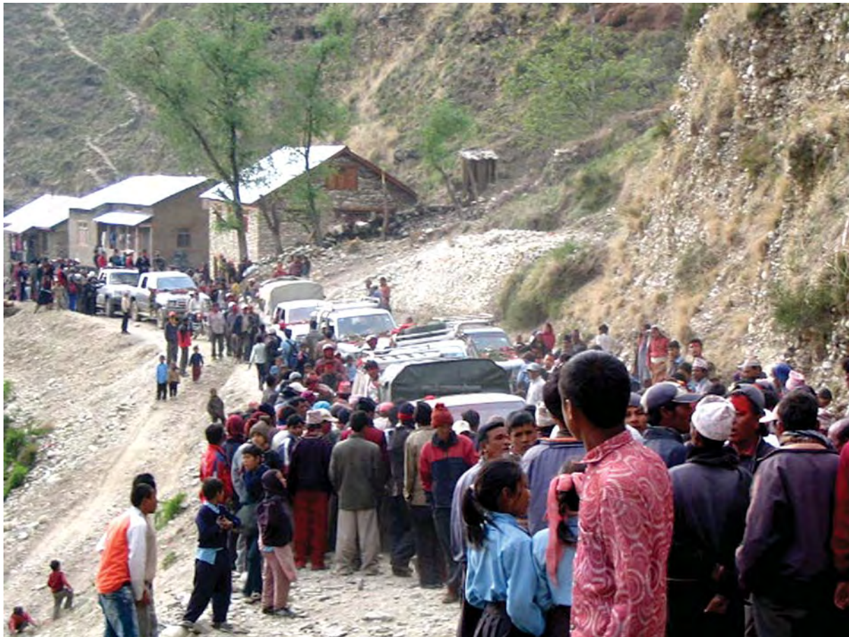
गतवर्षको अन्तिम दिन कर्णालीमा मोटर पुऱ्याउने सिलसिलामा जुम्ला नजिक सवारीसाधनका लस्कर

‘हुम्ला जुम्ला गाडीमा कहिले गुड्ने हो डुंगा चढी राराताल कहिले घुम्ने हो’