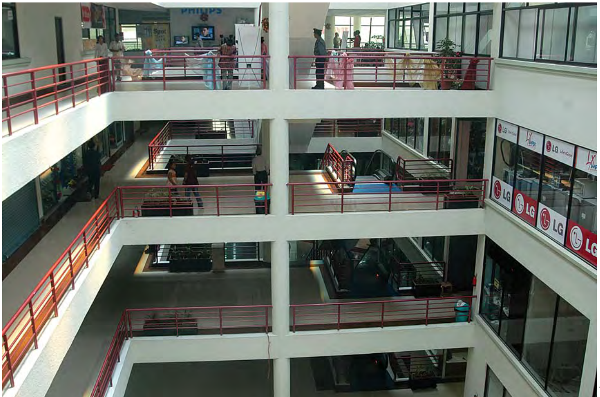
युनाइटेड वर्ल्ड ट्रेड सेन्टरको भवन

त्रिपुरेश्वरस्थित जनप्रशासन क्याम्पस रहेको ११ रोपनी जग्गामा सोही अवधारणाअनुसार एउटा व्यापारिक भवन निर्माण गर्न त्रिभुवन विश्वविद्यालय तयार भएपछि यो भवन निर्माणको सपना सुरु भएको थियो, २०५० को सुरुमा । तर विश्वविद्यालयले आह्वान गरेको पहिलो टेन्डरमा निजी क्षेत्रले सन्तोषजनक प्रस्तावहरू दिन सकेन । मुलुक माओवादी हिंसाबाट आक्रान्त बनिरहेका बेला लगानीकर्ता भौतिक पूर्वाधार निर्माणको क्षेत्रमा दिगो लगानी गर्ने 'मुड'मै थिएनन् । दोस्रो आह्वानमा भने युनाइटेड वर्ल्ड ट्रेड सेन्टर इन्जिनियर्स प्रालिले अत्याधुनिक ६ तले भवन बनाउने प्रस्ताव गर्‍यो, जुन अन्य प्रस्तावहरूको तुलनामा राम्रो थियो । २ वर्ष निर्माण अवधिबाहेक ३० वर्षसम्म भवन सोही कम्पनीको मातहतमा संचालन हुने र यस अवधिमा २० करोड रुपैयाँ त्रिभुवन विश्वविद्यालयलाई बुझाउने प्रस्ताव आकर्षक नै मानियो । उसको प्रस्ताव स्वीकृत गरियो । यो व्यवसायिक भवन निर्माणमा विश्वविद्यालयको ११ रोपनी जग्गा प्रयोग