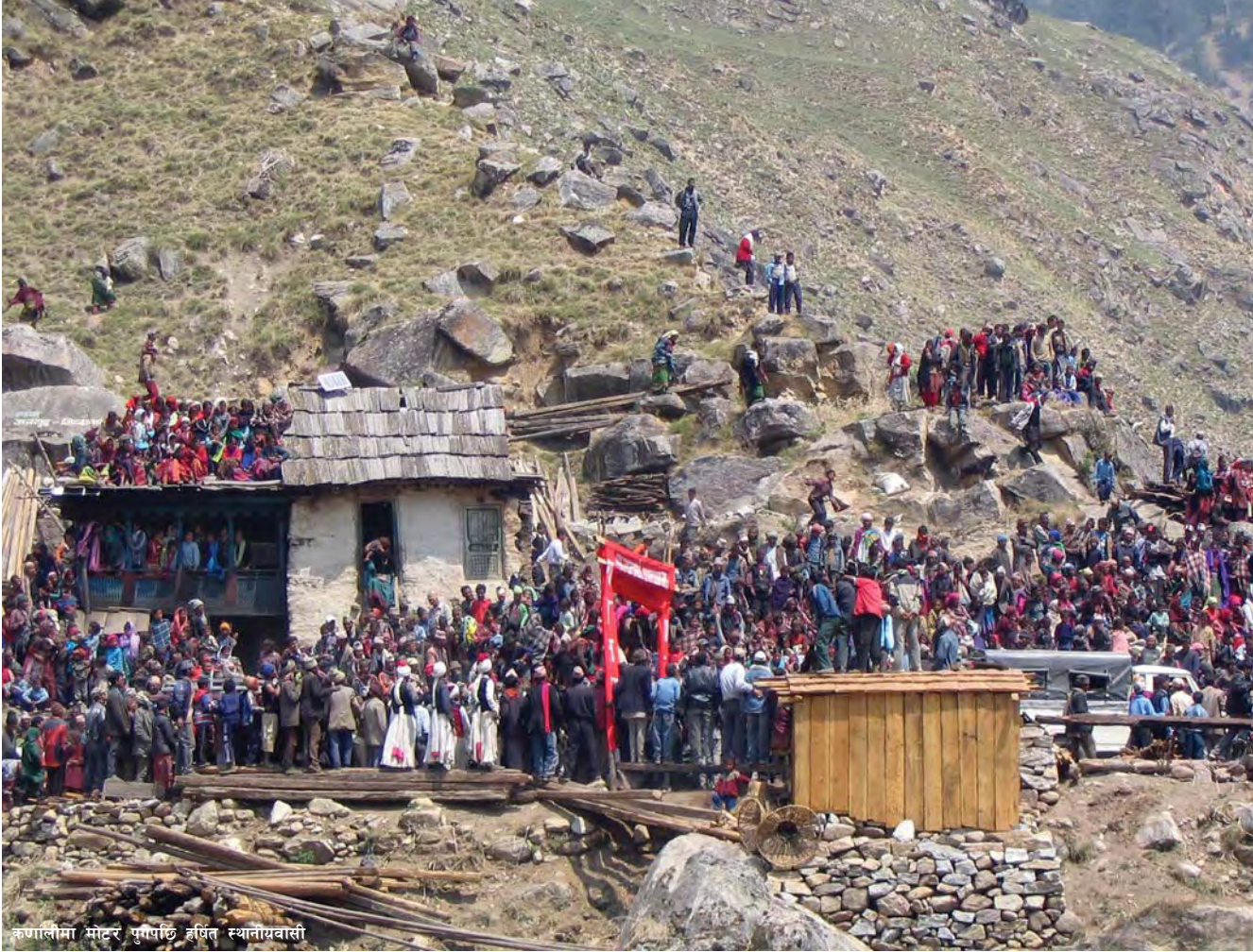
कर्णालीमा मोटर पुगेपछि हर्षित स्थानीयवासी