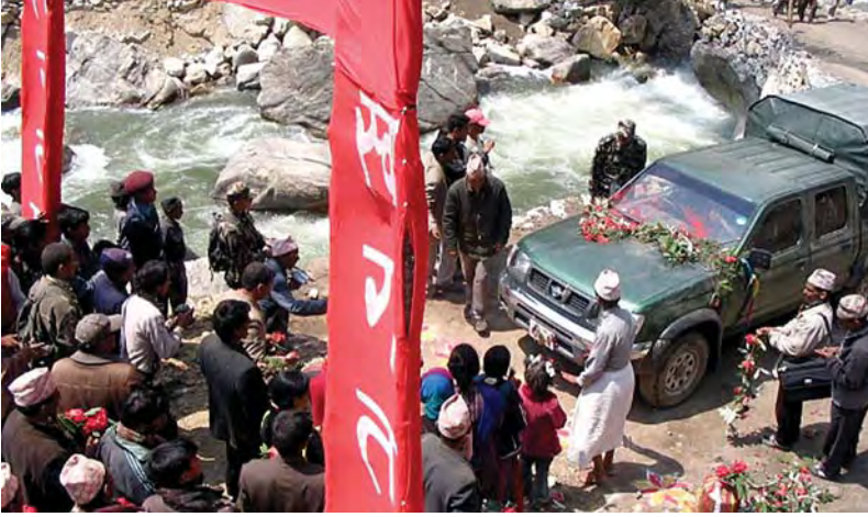
कर्णालीमा पुगेको सेनाको मोटरलाई स्वागत गर्दै स्थानीयवासी