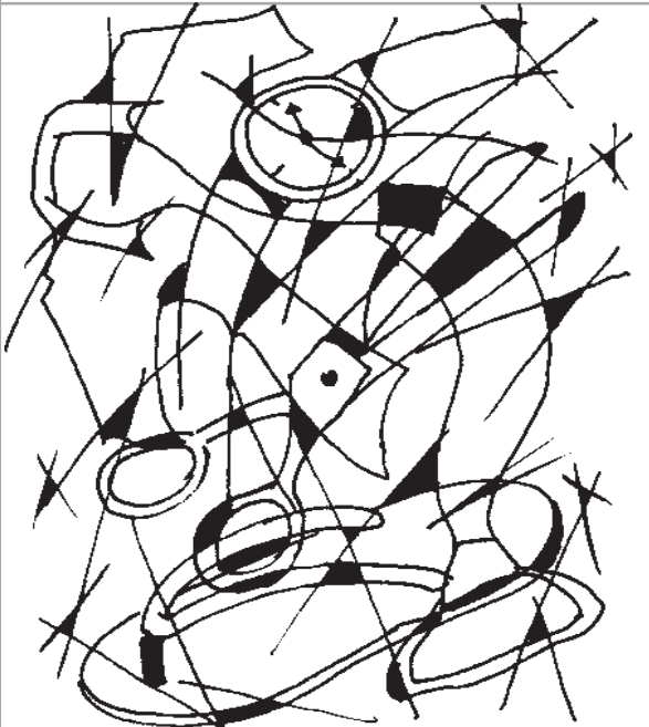
। डाट 'लामा' 'रुकु' 'लामा' 'रुकु' : कृष्णलामा 'कृष्ण'

तल दिइएको चित्रमा कति समानहरू लुकेका छन् ?