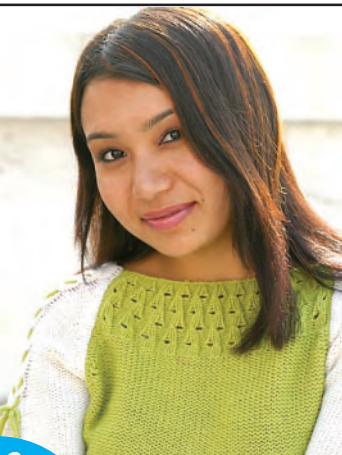
१० पृष्ठमा नजिकबाट प्राशना