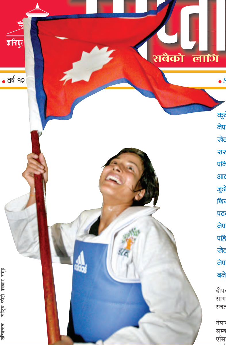
तस्वीरहरू : राष्ट्रिय फोटो पत्रकार समूह

कुनै पनि अन्तर्राष्ट्रिय प्रतियोगितामा नेपालले पदकको आशा मार्सल आर्ट खेलसँग सम्बन्धित खेलहरूबाटै राख्ने गरेको छ। दोहा एसियाडमा पनि नेपालले पदकको आशा मार्सल आर्ट अन्तर्गतकै बक्सिङ, तेक्वान्डो, जुडो, कराँते तथा उसुबाट राखेको थियो तर आशा विपरीत नेपाल जुडोतर्फ पदकविहीन भैसकेको छ भने नेपाललाई एसियाली खेलकुदमा पहिलो पदक दिलाउने श्रेय बोकेको खेल बक्सिङका हकमा दोहा एसियाड नेपालका लागि नमीठो संस्करण बनेको छ।