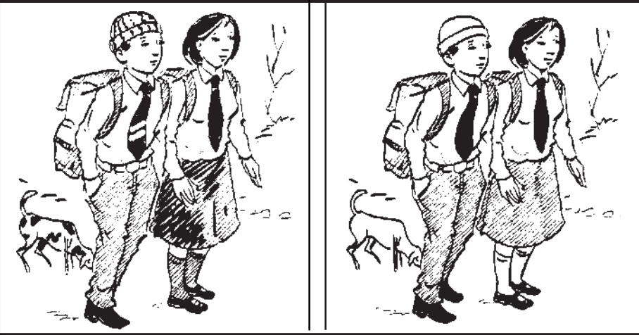
। झार 'लामा' 'कृष्ण' 'डाट' 'लामा' 'रुकु' -कृष्ण

तल दिइएको चित्रमा कति समानहरू लुकेका छन् ?