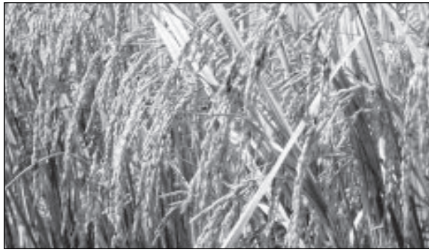
बताएपछि नेपालमा गत वर्षदेखि अनुवंश परिवर्तनसम्बन्धी नीति बनाउने प्रक्रिया सुरु गरिएको थियो।

भिटामिन 'ए' युक्त धान बन्छ। विश्वमा 'गोल्डेन राइस' नामबाट चिनिने यस्तो धानको चामलबाट बन्ने भातले शरीरमा चाहिने भिटामिन 'ए' को आवश्यकता पूर्ति गर्ने बताइएको छ। विश्वमा यस्तो धान उत्पादन गरिरहेका राष्ट्रहरूको सञ्जालमा नेपाल समावेश भएपछि यस्तो धानको बीउ ल्याउन पाइने प्रावधान छ। स्वीजरल्यान्डबाट सुरु भएको भिटामिन 'ए' युक्त धान उत्पादन गर्ने क्रम अहिले विश्वका धेरै देशमा सुरु भैसकेको छ। स्वीजरल्यान्डका वैज्ञानिक इन्द्रस पोत्रिकसले सबैभन्दा पहिले यस्तो धान उत्पादन गरेका हुन्।