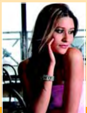
साइबर गर्ल रमणी