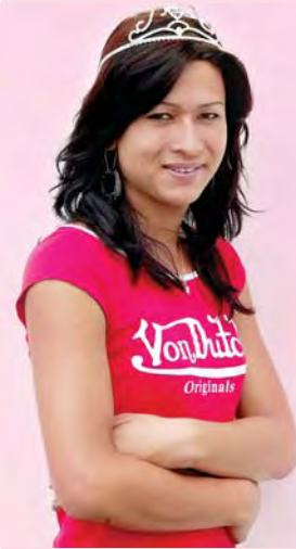
मुकुट पहिरिँदा कस्तो अनुभव भैरहेको छ ?

सबैभन्दा मुख्य कुरा लैङ्गिक असमानताका विरुद्ध आयोजित यो प्रतियोगितामा सहभागी भएर आफ्ना कुरा राख्ने इच्छा थियो। जुन यो प्रतियोगिताले अवसर जुटाइदियो। प्रतियोगिता भनेपछि हारिँदा अत्यन्तै हल्का मेरो परफोर्मास राम्रो भएकाले हुनसक्छ, मैले सर्वोत्कृष्ट हुने मौका पाएँ, अत्यन्तै खुसी लागेको छ।