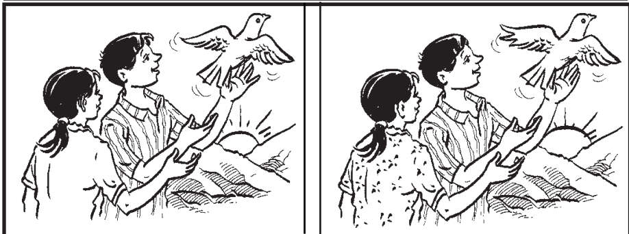
। फरक-फरक 'कपाल', 'गाल', 'आँखा', 'सुँठ', 'परेवाको पंख' पढाऊ ।