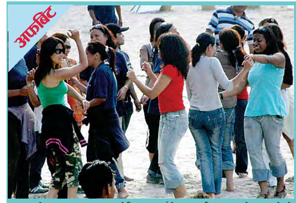
खोला-बजारमा जाच : केटीएम कार्डले गत शनिवार आयोजना गरेको च्याफ्टिडको अवसर पारेर बगरमा नाच्दै संगीतकर्मी तथा भिजेहरू ।