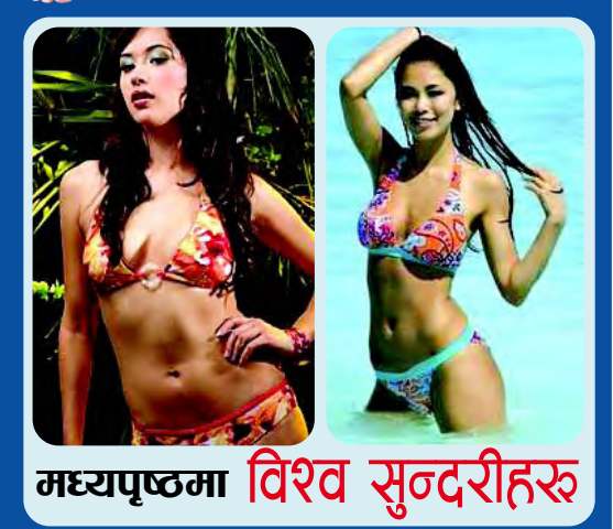
मध्यपृष्ठमा विश्व सुन्दरीहरू