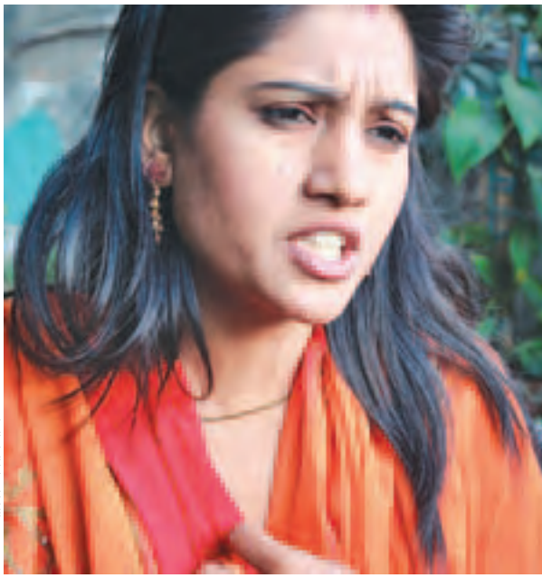
चित्र : नवराज बाको

विवाहपछि हामी थप लोकप्रिय मात्र भएनौं, हप्तेपिच्छे सांस्कृतिक कार्यक्रमका लागि काठमाडौँबाहिर गैरहनुपुरेकाले वर्ष दिनभरि नै हनिमुन मनाइरहन पायौं। विवाहअघि र विवाहपछिको धुर्मुसमा के अन्तर पाउनुभयो ? विवाहपछि हामी दुवै जना अभिनयकर्ममा यति धेरै व्यस्त भयौं