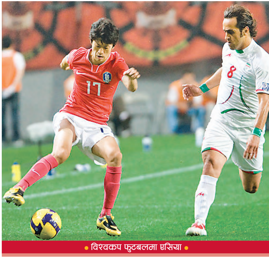
• विश्वकप फुटबलमा एसिया •

फाइनल चरणमा अस्ट्रेलियाले पहिलो पटक प्रवेश पाएको थियो। उक्त विश्वकपमा अस्ट्रेलिया पहिलो चरणबाटै घर फर्कियो। त्यसको ३२ वर्षपछि अस्ट्रेलियाले पुनः जर्मनीले नै सन् २००६ मा आयोजना गरेको विश्वकप प्रतियोगिताको फाइनलमा खेल्ने मौका पाएको थियो। उक्त विश्वकपमा अस्ट्रेलियाले आफ्नो स्तरमा सुधार गर्दै आफूलाई दोस्रो चरणसम्म पुऱ्यायो। दोस्रो चरणमा अस्ट्रेलिया इटालीद्वारा शून्यका विरुद्ध १ गोलले पराजित भएर घर फर्कियो। यसपटक अस्ट्रेलियाले एसियाका तर्फबाट प्रतिनिधित्व गर्दै चौथो चरणमा समूह 'ए' को विजेता भएर १९