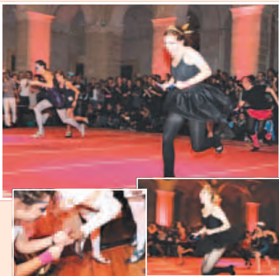
हाइ हिल रेस

पेरिसमा हालै हाइ हिल रेस सम्पन्न भयो । १ सय ८० मिटरको यो रेसमा ९६ जना महिला हाइ हिल जुता लगाएर दौडिएका थिए । महिलाहरू 'सुपर वुमेन' हुन् भन्ने कुरा देखाउन उक्त दौड प्रतियोगिता आयोजित गरिएको आयोजकले बताए ।