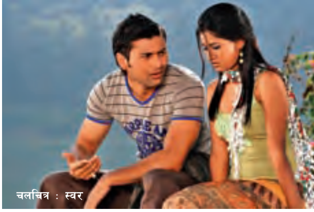
चलचित्र : स्वर