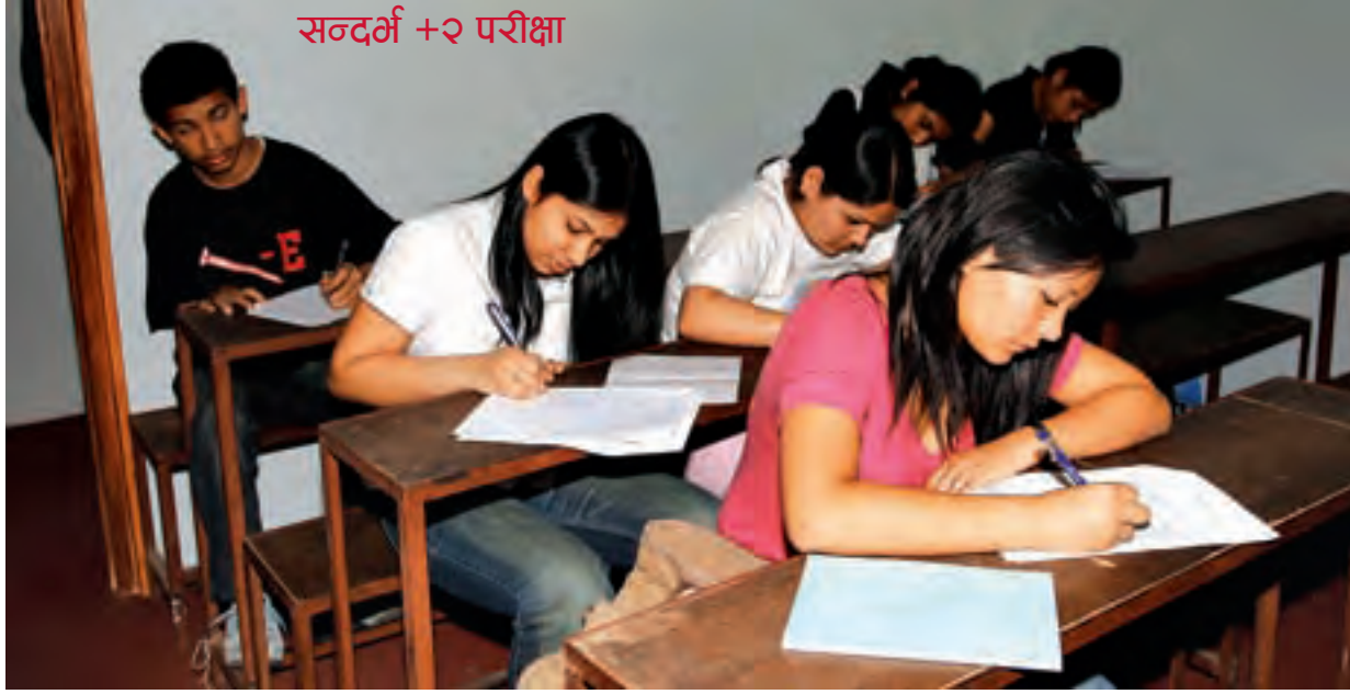
सन्दर्भ +२ परीक्षा

• कुनै पनि प्रश्नको उत्तर लेख्ने शब्द सीमा हुन्छ। त्यसैले तोकिएको शब्द सीमाभित्र उत्तर दिने प्रयास गर्नुपर्छ, जसले उत्तर सटीक लागोस्।