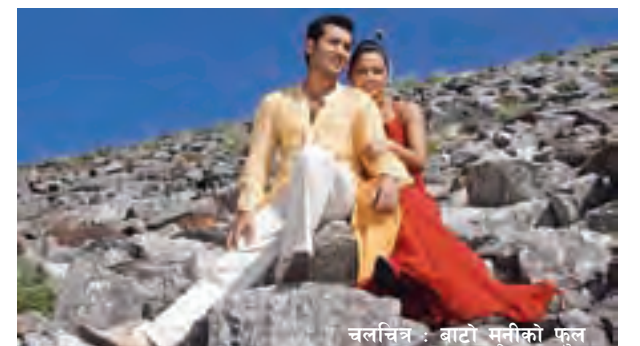
चलचित्र : बाटो मुनीको फूल

प्रेमका कारण बन्दी हुन पुगेका युवकहरूको कथामा आधारित