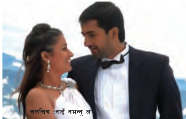
चलचित्र : नाई नभन्नु ल