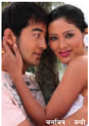
चलचित्र : बन्दी