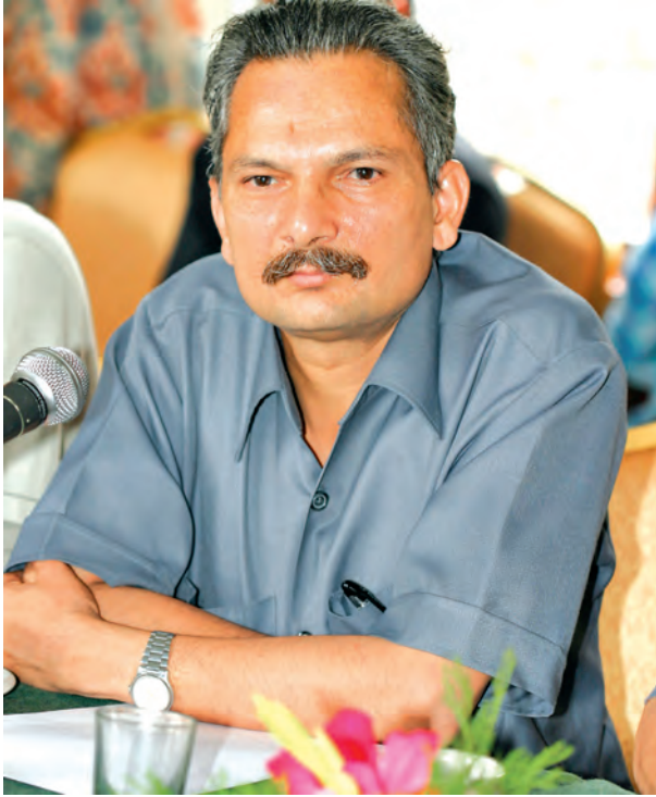
डा. बाबुराम भट्टराई