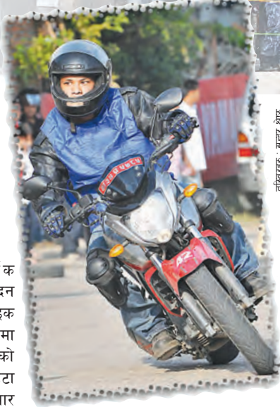
बाँकी पृष्ठ २० मा

मो टरबाइक रेस हेर्न नेपाली दर्शक टेलिभिजनको स्क्रिनमै सीमित हुने दिन टुंगिएको छ। अब आफ्नै देशमा बाइक हुरैक्याएको हेर्न पाइने मात्र होइन, त्यसमा सहभागीसमेत हुन सकिनेछ। यसको सुरुआत गतवर्षदेखि 'यामाहा राइडटेक च्यालेञ्ज' ले एउटा हाउजिडबाट गरे पनि यो वर्ष भव्यताका साथ गत शनिवार सम्पन्न गरेको छ। नेपालमा रेस कोर्स अर्थात् मोटरसाइकल रेसको आधुनिक टुचाक छैन। त्यसैले पिच सडकमै मोटरबाइक हुरैक्याउनु नौलो कुरा भएन।